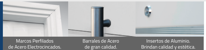
Marcos Perfilados de Acero Electrocinados.